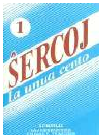
Ŝercoj, la unua cento

Luit kunportis dekon da libroj kaj libretoj kun humoraĵoj. El kelkaj el ili li voĉlegis kelkajn ŝercojn. Ekzemplo el sveda ŝerclibro: