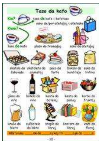
specimena paĝo de Poŝamiko

Li raportis pri sia serĉkampanjo por aktualigi la faldfolion de Pasporta Servo . Estis trafa ekzemplo de la esprimo 'de la ŝranko al la muro'.